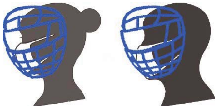
小中学生のイメージ